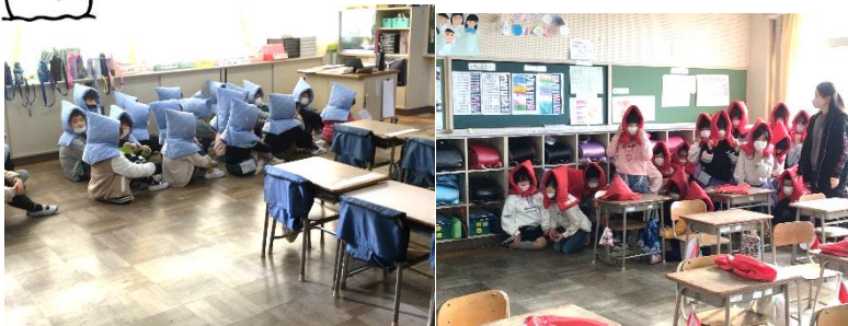
放送を聞き、担任の指示で頭巾をかぶり、静かに身を潜めました（1・2年）

授業中に不審者が校舎内へ侵入した際の避難や通報、さすまた使用等の訓練を行いました。