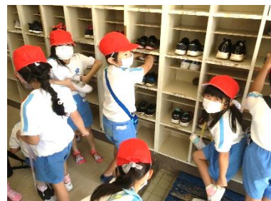
下駄箱に並べて入れる(1年生)

1つ目の「 下駄箱の靴の整理整頓ができる 」はチャレンジ達成です。昇降口を通ると靴がきれいに並んで気持ちが「 あたたかく 」なりました。これからも続けて下さい。