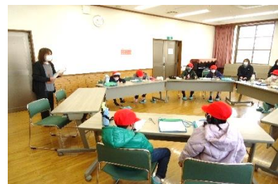
校外学習~町探検~(2年生)

また、その他に作品応募やタブレット学習、学び合い活動、修学旅行や校外学習などいろいろな活動に頑張ったあかいつ子でした。振り返ると 落ち着いた学校生活の中であかいつ子一人一人の笑顔が輝き、大きく成長したことが感じられました 。(中略)