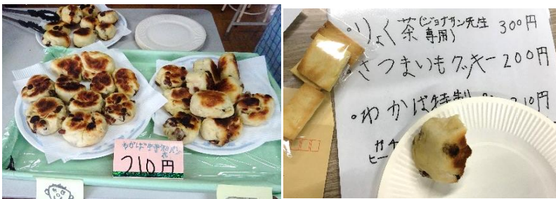
出来たての温かいパン