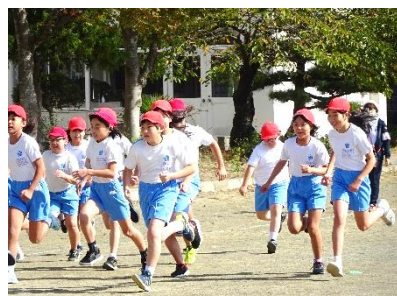
自己との闘い! 持久走(5年生)

2つ目の「 持久走記録会では目標を立てて練習に取り組む 」も、チャレンジ達成です。当日の記録会だけではなく、記録会に向けて、休み時間に練習するあかいつ子がたくさんいました。チャレンジはその時だけではなく、事前の準備がとても大切です。体力を付ける、スピードを付ける、そして、最後まで走る意欲を持つ、 それら事前の準備をしっかりとしておくことで、自信を持って走ることに繋がりました 。あかいつ子の「 いきいきと 」した頑張りが見られました。