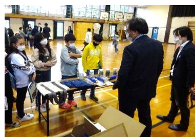
ゴミ問題の出前講座(4年生)

心あったかイトころ運動のクリーンタイムや無言清掃で、清潔な学校の大切さやゴミが命あるものに与える悪い影響をあかいつ子はよく知っていることで、進んでゴミ拾いに取り組みました。環境を考える「 かしこい 」あかいつ子でした。